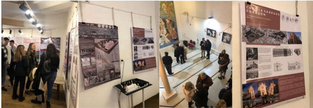
Muestra en el Museo Beato Angélico.