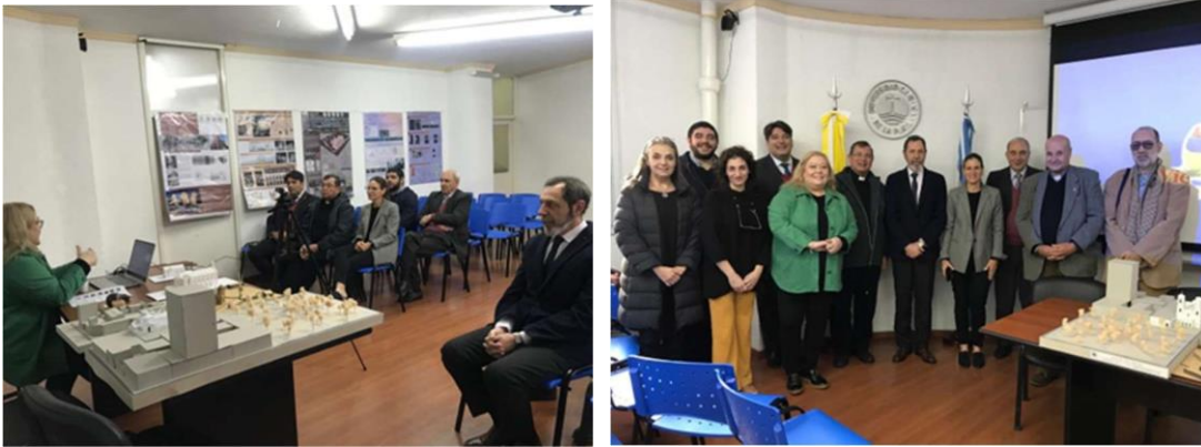
Izq. Durante el evento. Der. Moseñor Tissera con los participantes del evento.

Esta actividad, forma parte de las tareas de planificación relacionadas con la difusión de la investigación, que demanda de una constante política activa de comunicación y divulgación del conocimiento producido.