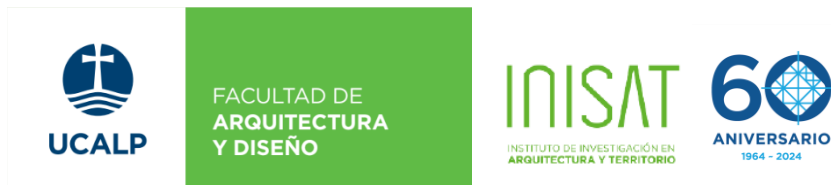
Captura del flyer del Facebook de Ucalp. Arquitectura y Diseño. © Elaboración de las autoras.