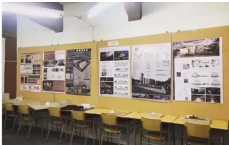
Muestra en Fad, sede Bernal.

-Muestra de fin de año Talleres de Arquitectura y Diseño , exposición en instalaciones de la sede metropolitana de la Fad Ucalp. Diciembre 2022.