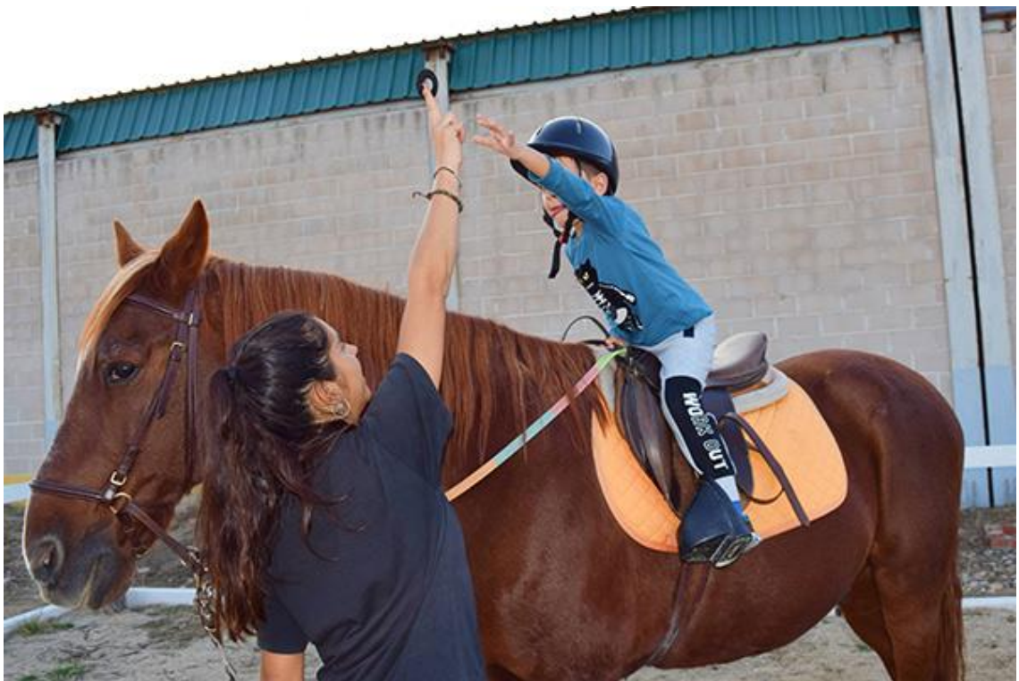
Imagen ejercicios y actividades