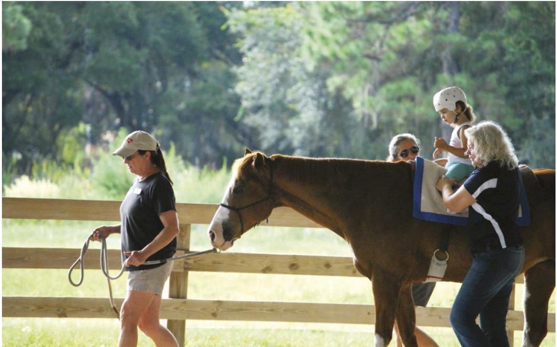
Imagen monta terapéutica