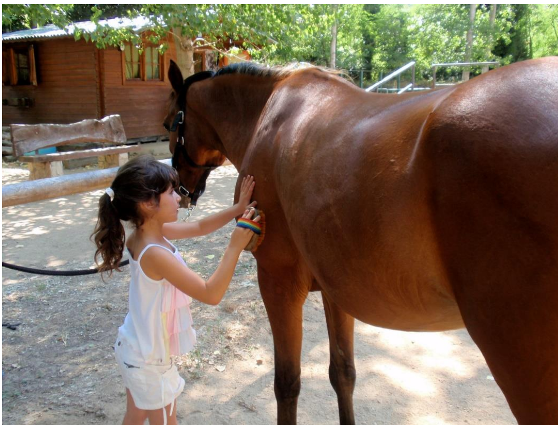
Imagen. Cepillado y manejo del caballo