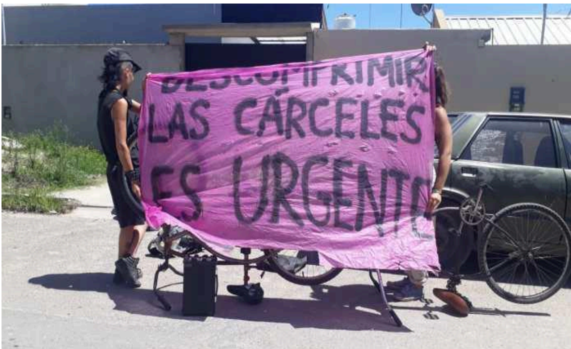
Protesta en 2020 bajo el lema: “Descomprimir las cárceles es urgente”.

“La idea es tratar de reconstruir ese camino, pensando en un camino que garantice una evaluación seria de las posibilidades de riesgo que pueda tener esa persona. Y a partir de eso decidir si esa persona tiene que estar privada de la libertad o no, y sobre todo pensar si hay alternativas como prisiones domiciliarias, que requieren un control sobre las personas y no sobrecargar el sistema”, indicó.