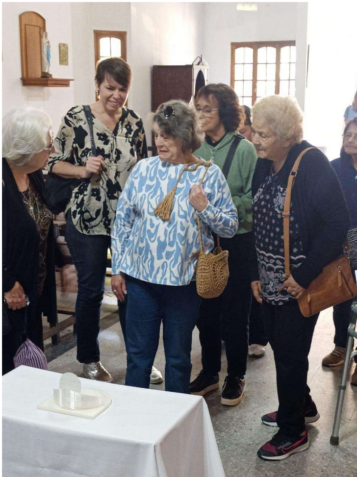
Luego de las explicaciones y consultas, la gente observando con entusiasmo la impresión 3D.