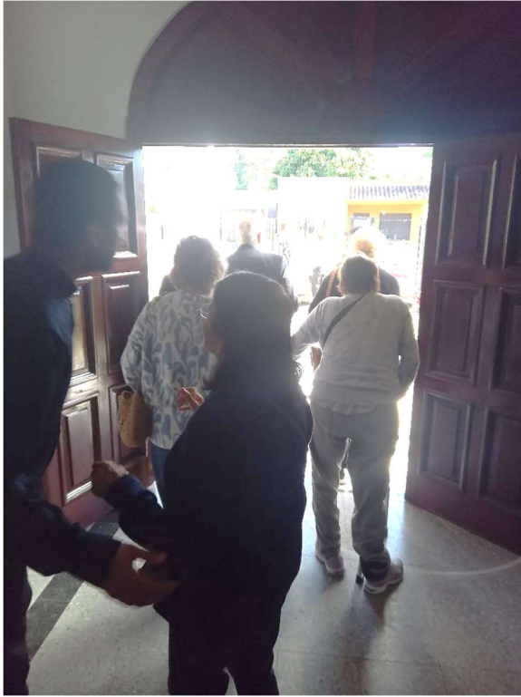
Los miembros de la Comunidad se retiran muy contentos.