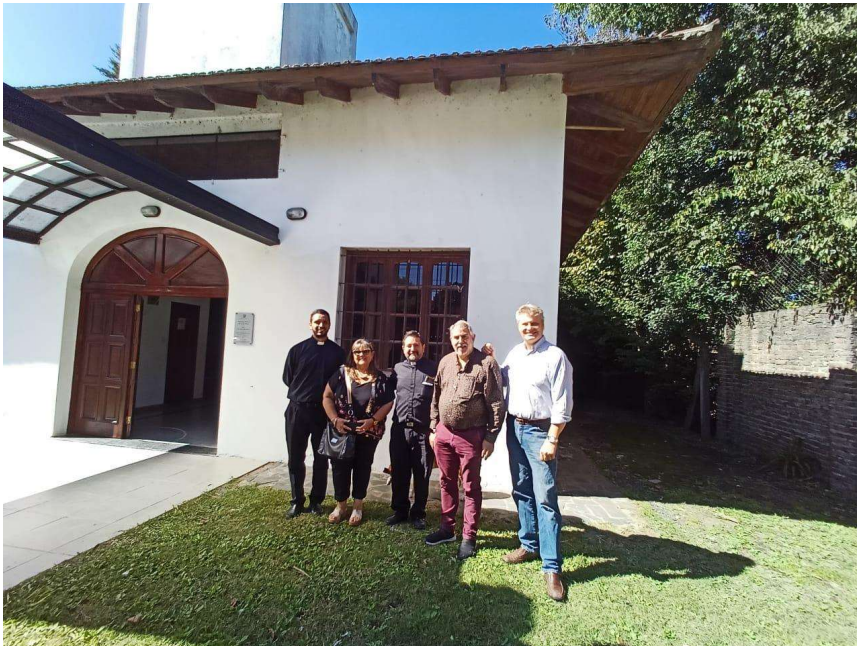
En el lugar del futuro emplazamiento.