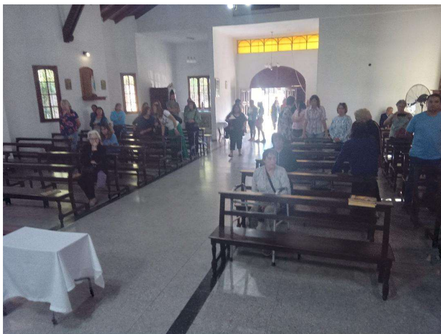
La gente llegando a la presentación.

Con gran alegría y participación de la Comunidad se realizó la presentación del proyecto de Extensión, posicionando a la UCALP en el máximo nivel no solo académico por la calidad del material expuesto y el impacto que ello causó, sino a nivel comunitario, al servicio de instituciones como en este caso la Parroquia Nuestra Señora de Luján. Concluida la presentación, los miembros de la comunidad demostraron fervientemente la colaboración para reunir los recursos necesarios para dar comienzo a la obra.